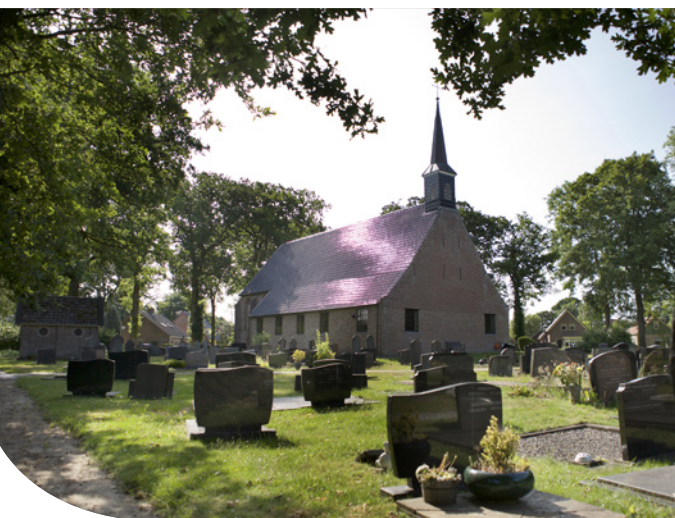
Kapel en begraafplaats Oldemarkt

We vinden het fijn als u meegaat! Aanmelden gaat het eenvoudigst op onze website, www.dle-uitvaart.nl/tocht . U krijgt dan gelijk een bevestiging van deelname. Er is beperkte deelname mogelijk. Meldt u zich dus snel aan!