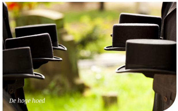
De hoge hoed